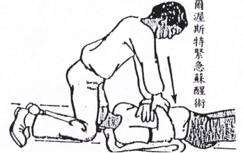
席爾渥斯特緊急蘇醒術